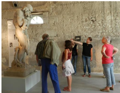
Visite commentée