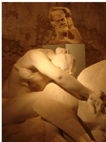
Léda et le cygne – crédit DAMM Musée Jules-Desbois