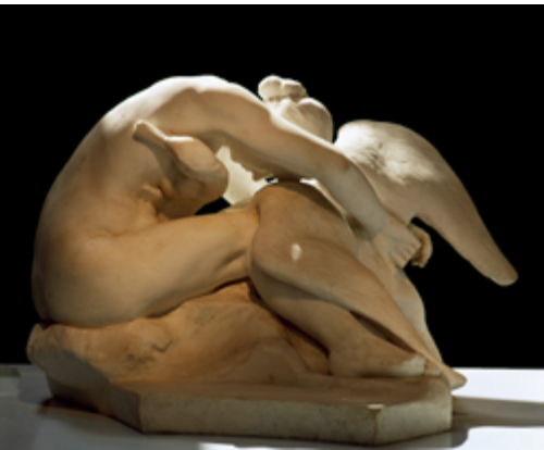
Leda et la cygne - musée Jules-Desbois