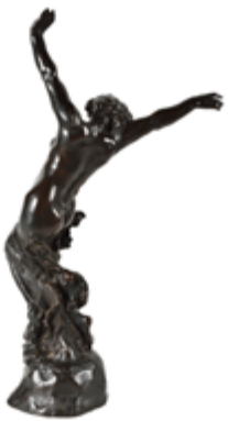
Salomé - Jules Desbois - CNAP, musée Jules-Desbois