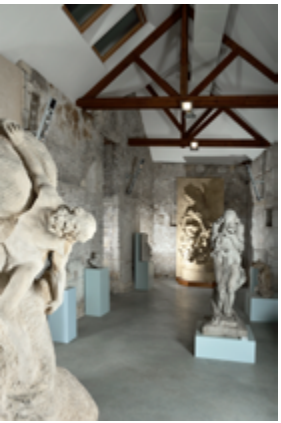
musée Jules-Desbois - crédit CDP 49 Rousseau