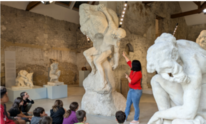
Animation scolaire - musée Jules-Desbois