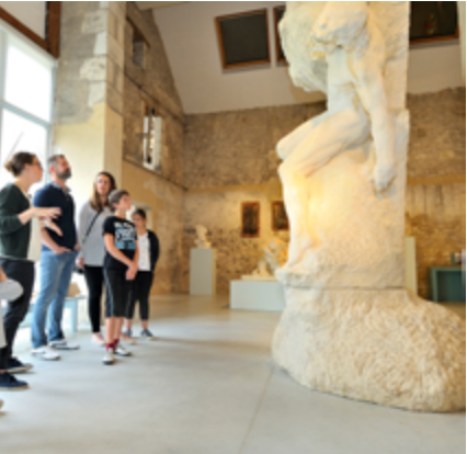
Visite au musée Jules-Desbois